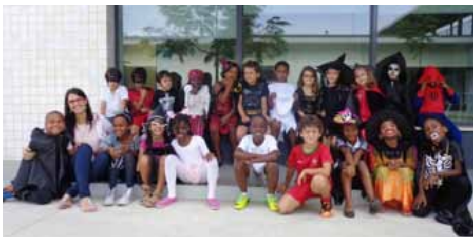
Turma do Colégio S. Francisco de Assis, Luanda Sul (Angola)

Atendendo aos valores contemporâneos da globalização e da sua consequente multiculturalidade, torna-se relevante e urgente que se conheça, desde a mais tenra idade, a "Aldeia Global" em que habitamos, para que nela as crianças cresçam aprendendo.