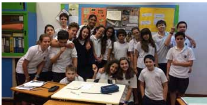
Turma do 8º ano de escolaridade da Escola Portuguesa de Macau

Ainda durante o ano letivo de 2014/2015, os alunos das turmas do 6º ano de escolaridade participaram num projeto de intercâmbio com os colegas da Escola Portuguesa de Macau, subordinado ao tema “Lusofonia”, que teve como objetivo reforçar os laços entre escolas portuguesas no estrangeiro e promover as trocas culturais entre países e territórios lusófonos.