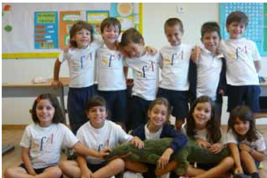
Turma do Colégio S. Francisco de Assis do Lagoas Park (Portugal)

Estes objetivos viram-se concretizados em atividades trimestrais, orientadas e supervisionadas pelas respetivas professoras titulares de cada turma. Essas atividades incluíram a partilha de lendas e tradições de cada país, livros de autores portugueses e angolanos, fotos das turmas, dos respetivos colégios e do meio envolvente, promovendo-se, desta forma, o estímulo da expressão escrita fomentado pela troca de correspondência entre turmas.