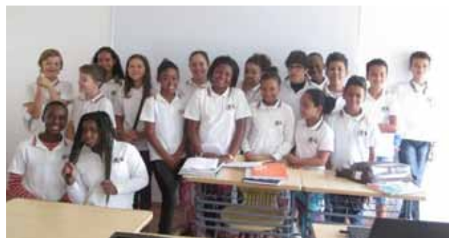
Turma do 6º ano de escolaridade da Escola Portuguesa do Lubango

Para tal, foi criado um grupo na página de moodle da EPM, elaborado um vídeo de apresentação dos alunos da Escola Portuguesa do Lubango, disponível em canal fechado do Youtube, e enviadas fotografias retratando as duas cidades envolvidas.